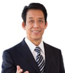
川端達夫 常任顧問 (前衆議院副議長)

志を同じくし、団結を固く各地域で精力的に活動してまいりますので、ご支援をお願いいたします。