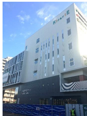
完成間近のキラリエ(1月撮影)

具体的には、キラリエの供用開始に伴い閉鎖するサンサンホールや草津市立まちづくりセンターの指定管理者の指定期間の変更です。今回の議決により、両施設の機能はキラリエに移ります。