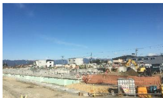
工事中の給食センター(1月撮影)

次年度の3学期から開始する予定の中学校給食に向けて、草津中学校と新堂中学校に配膳室を増築する工事の契約を審議いたしました。