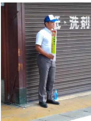
9/30 自転車安全パトロール