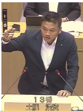
10/28 草津市議会定例会