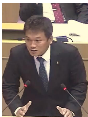
12/11 草津市議会定例会