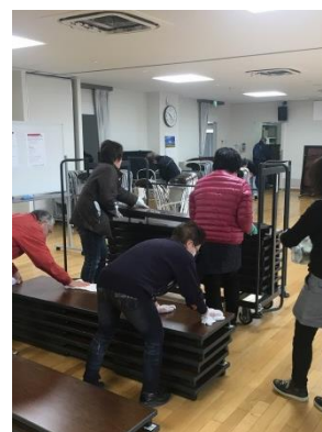
12/14 大路まちセン大掃除