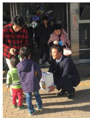
11/30 台風被災募金活動