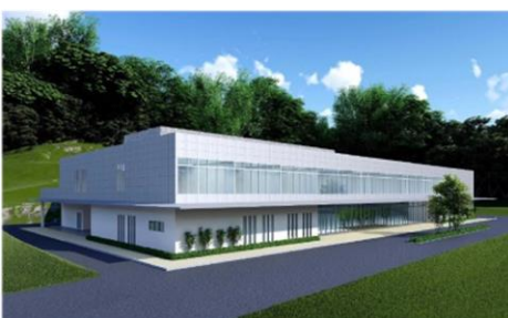
イメージパース(火葬場整備基礎調査より)

11月定例会の総務常任委員会において「新火葬場施設の整備および運営のあり方」について所管事務調査(*)を行うことが決まりました。