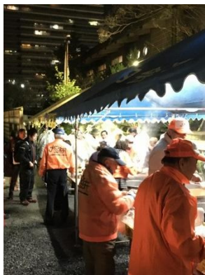
12/31 小汐井神社そば接待