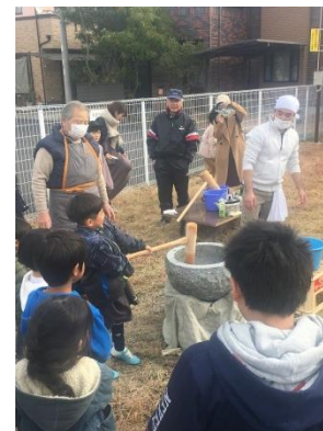
12/21 町内もちつき大会