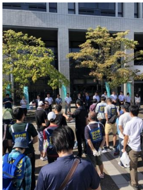
9/15 びわ湖クリーンキャンペーン