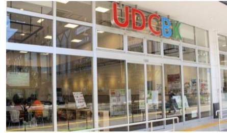
アーバンデザインセンター

いずれの項目についても残課題はあります。特に「産学公民との協働によるまちづくりの展開」における、南草津駅前に設置した「アーバンデザインセンター運営事業」(*)については、運営コストが多額であるにもかかわらず成果や市民認知度が不十分であるため、費用対効果を含めた改善見直しを求めました。