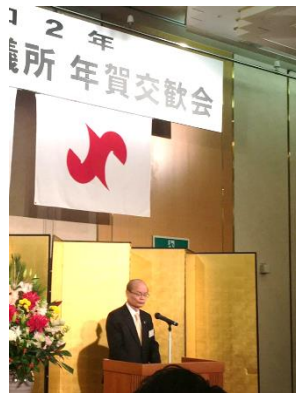
1/6 草津商工会議所年賀交歓会