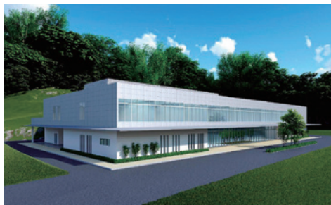
イメージパース（火葬場整備基礎調査より）

6月定例会において、前年度に草津市と栗東市が共同で実施した「火葬場整備基礎調査」の結果についての一般質問を行ない、今後の火葬場整備に向けた草津市の考え方や方向性について確認し、議論を交わしました。