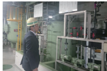
県外視察研修(1/12) (広島県 福山市)