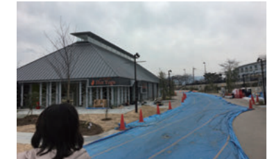
草津川跡地公園 視察(3/31)