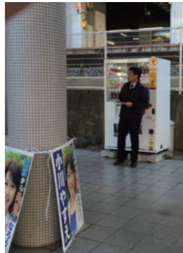
朝の駅頭活動(定例)