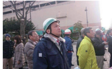
春季消防総合演習 (3/4)